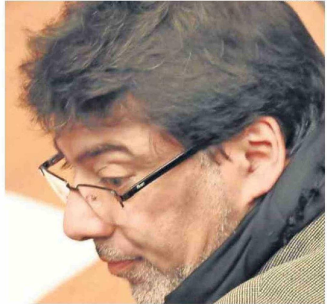
EN EL 3° JUZGADO DE GARANTÍA DE SANTIAGO SE LLEVÓ A CABO HACE ALGUNAS SEMANAS LA FORMALIZACIÓN.