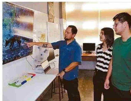
LOS ESTUDIANTES REVISAN EL MATERIAL EN EL AULA.

Otro hallazgo del proyecto es que en los sende-