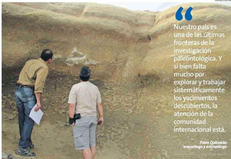
BAHÍA INGLESA ES UNO DE LOS SITIOS FOSILIFEROS MÁS IMPORTANTES DEL PAÍS.

Probablemente, no hay historia más significativa para toda la humanidad y para todos nosotros que la historia de cómo nos transformamos en lo que somos. Y no hablo sólo de la humanidad, hablo de todos los seres vivos: de cómo una planta llegó a ser esa planta, de cómo un insecto llegó a ser ese insecto. En ese sentido, esta historia de la vida,