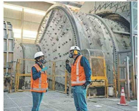
LA MINERÍA SERÁ CADA VEZ MÁS INTENSIVA EN EL CONSUMO DE AGUA.