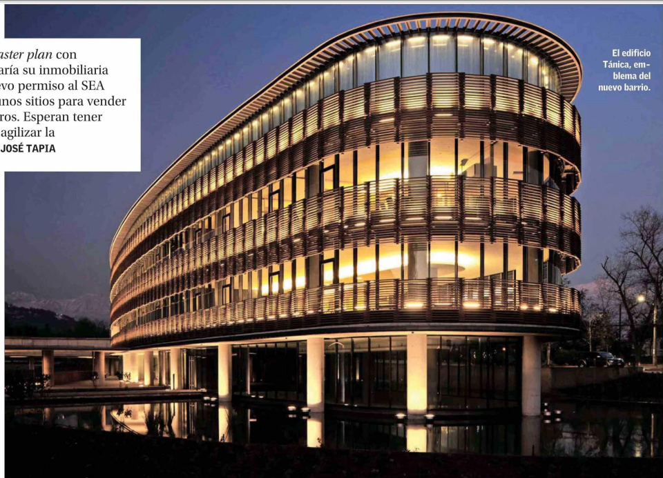
El edificio Tánica, emblema del nuevo barrio.

En el mercado señalan que su venta ha si-