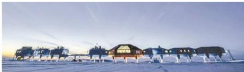
Halley VI en la Antártica.

con sus estudios y observaciones, descubrieron una gran amenaza que se cierne sobre nuestro planeta, el gran agujero abierto en la capa de ozono de la estratosfera terrestre. Durante el invierno de 1986 el cielo lució un borrón blanquecino, una especie de bola de nieve lanzada con fuerza contra el firmamento nocturno, se trataba del cometa Halley. El último paso por el perihelio del cometa Halley se produjo el 9 de febrero de 1986 y el próximo se producirá el 28 de julio de 2061.