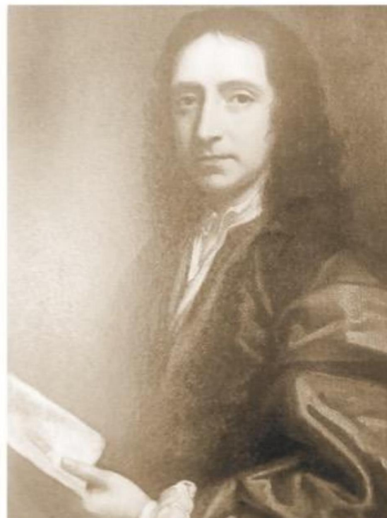
El joven Edmund Halley.

El HMS Paramour partió de Inglaterra en 1698 a instancias del Rey de Inglaterra Williams III. Era la primera misión puramente científica educativa de un buque naval inglés y estuvo marcada por las disputas entre el capitán Halley y los oficiales por su competencia para comandar el barco. El HMS Paramour era un navío de 16 metros de eslora y 5 de ancho para su expedición científica subantártica y antártica. Antes se nombró a Halley el comandante de la nave. El barco de plan holandés y de formas redondas y amplias, bien adoptado a mares peligrosos. Paramour era un tipo de barco conocido como rosa,