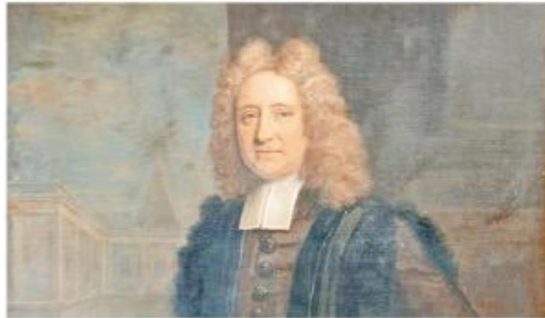
Edmund Halley fue un gran astrónomo, pero también destacó en otras materias científicas.

El 14 de enero de 1842 se cumplió el centenario de la muerte del gran famoso astrónomo. Ya en Siglo XX, en la misma fecha el 14 de enero de 1942 se cumplió el Bicentenario del fallecimiento del famoso académico científico. Una década después de esta conmemoración en el mismo siglo se hacen los preparativos para instalar en el continente antártico una estación