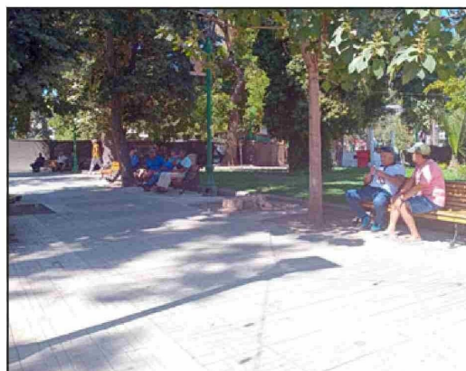
El lugar donde Noemí se instala a vender sus productos.

nerar complicaciones graves si no se trata a tiempo.