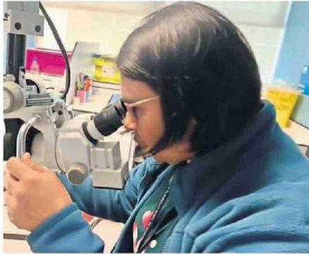
ANTIGUAMENTE SE TRASLADABA A ANTOFAGASTA A LAS MUJERES PARA PRACTICARSE ESTE PROCEDIMIENTO.

“Nosotros comenzamos a hacer las consultas de patología cervical en agosto del 2022 y luego tuvimos que esperar bastante tiempo hasta octubre de este 2024 para tener la autorización del Ministerio