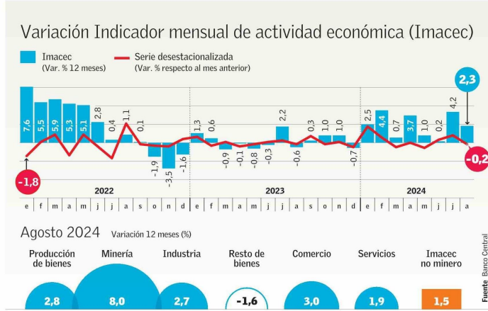
Agosto 2024 Variación 12 meses (%)

Hasta ahora, recapitula el coordinador macroeconómico de Clapes UC, Hermann González, el crecimiento acumulado en 2024 es de 2,3%, con lo cual la meta del Gobierno es "alta, pero no inalcanzable". Anticipa que