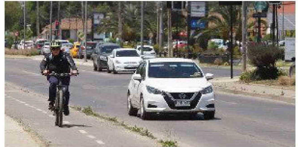
El Índice de Desarrollo Humano comparte una radiografía de cómo vivimos en la región de O'Higgins.

Respecto a la distribución de las categorías del desarrollo humano, en el nivel alto la