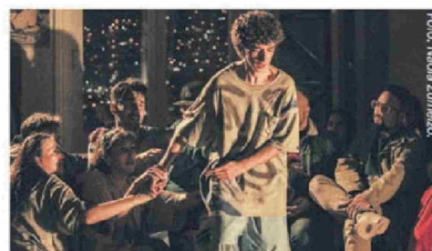
Romeo y Julieta.