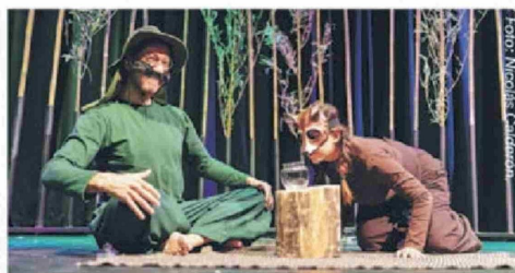
La venada ciega.