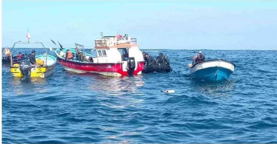
CERCA DE LAS 10 DE LA MAÑANA, SE HIZO EL HALLAZGO DE LA EMBARCACIÓN Y DE LOS TRES CUERPOS RESTANTES QUE FALTABAN POR UBICAR.