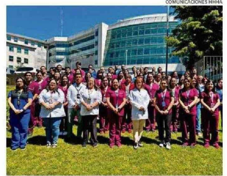
COMUNICACIONES HHA HOSPITAL FESTEJÓ SU ANIVERSARIO REALZANDO SU HISTORIA Y EL TRABAJO QUE REALIZAN LAS MÁS DE 100 PERSONAS QUE FORMAN EL EQUIPO.