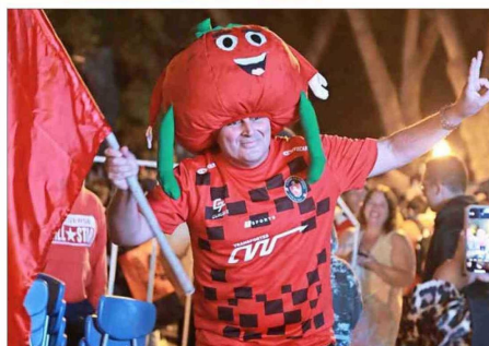
Vestidos como su tradicional tomate, los limachinos coparon el estadio para lentar a su equipo.