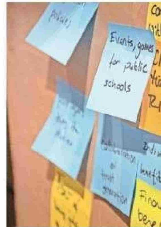
Las perspectivas planteadas en las discus... en forma colaborativa.