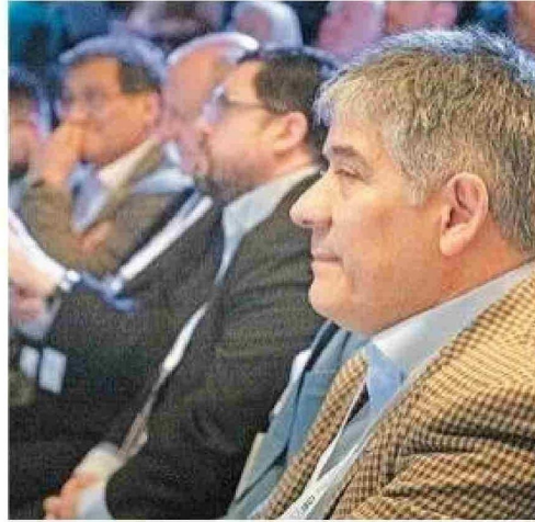
Las actividades del programa se realizaron entre el Cadi-Umag y el campus central. El evento contó con la participación de autoridades locales.

de puede surgir una colaboración. Y con el Instituto de Alemania, el Kit, para posibles visitas y estancias. También estoy pensando en ver la