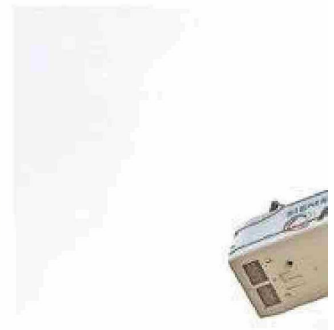
Magallanes es un paraíso eólico para la ind...

tivo. Hay que ponerlo en primera prioridad y abordarlo en conjunto para resolverlo".