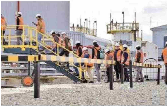
Planta Haru Oni.