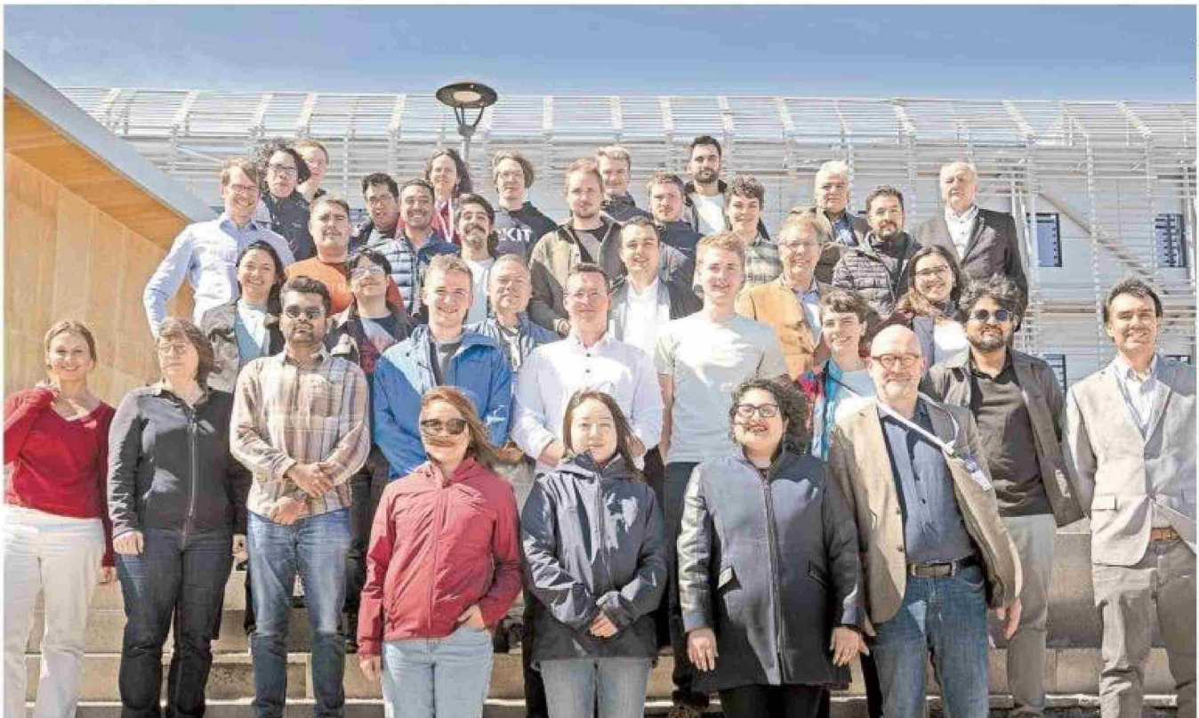
Foto grupal a la salida del Cadi-Umag.