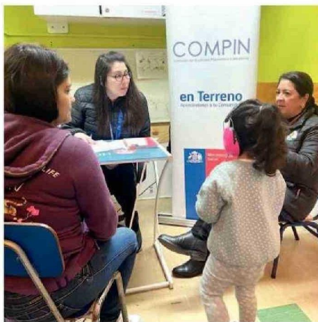
SE EVALUÓ EL GRADO DE DISCAPACIDAD DE LOS NIÑOS.

“A partir de esta resolución de discapacidad emitida por Compín, las