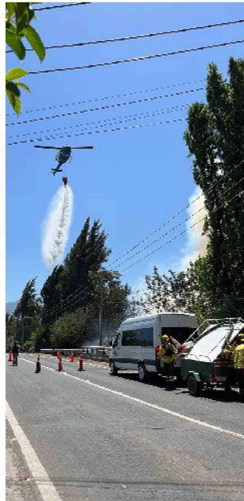
Con medios aéreos y terrestres fue combatido el siniestro