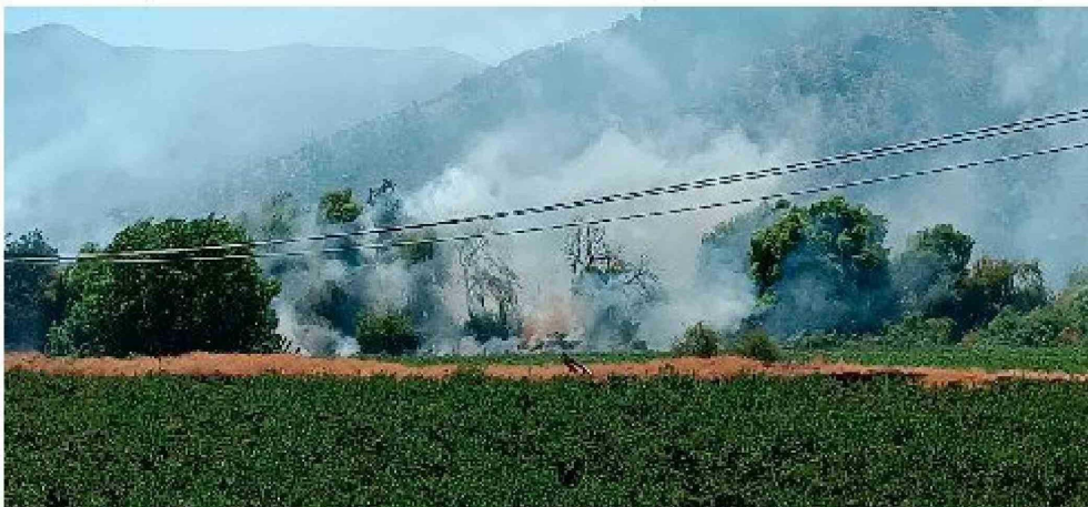
El siniestro se expandió hacia Graneros