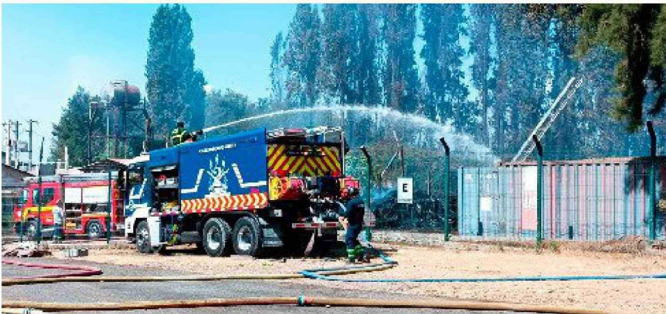
Según testigos un cortocircuito habría sido el origen del siniestro

en un recinto privado". El incendio fue controlado de manera terrestre con carros y voluntarios de bomberos, los brigadistas de la CONAF y el apoyo aéreo que contó con la presencia de dos helicópteros y dos avionetas, este incendio obligó a que se declarase Alerta Roja regional en Rancagua, según señalaron desde SENA-PRED el siniestro, afectó una superficie estimada de más de 1 hectárea y generó proyecciones de humo hacia la carretera. Además el fuego presentó una amenaza inminente a una subestación eléctrica ubicada a 400 metros del foco del incendio. En el combate del siniestro participaron 4 brigadas, 1 técnico, 2 helicópteros, y 2 aviones, además de Bomberos de Rancagua, Graneros y Mostazal. Durante la tarde del sábado, otras dos unidades de bomberos de Rancagua combatieron un incendio de una gran extensión de pasto con peligro de propagación a viviendas en el sector de la villa San Fernando, para el combate de este siniestro se solicitó apoyo a bomberos de Machali. ☞