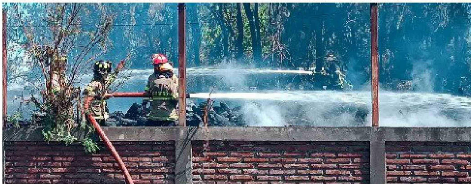
Este acopio de leña fue una de los puntos complejos en el control del incendio