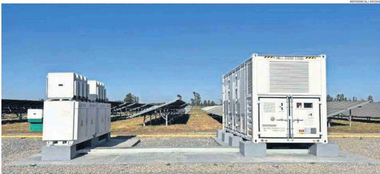
EL PROYECTO DE SISTEMA DE ALMACENAMIENTO DE ENERGÍA Y LÍNEA DE TRANSMISIÓN BESS PUEBLO HUNDIDO, TIENE UNA INVERSIÓN DE 400 MILLONES DE DÓLARES Y SU FECHA DE INICIO DE EJECUCIÓN SERÍA OCTUBRE DEL 2025.