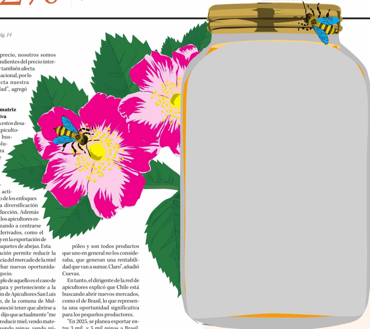
ILUSTRACIÓN - ANDRÉS OREÑA P.

Twitter @DiarioConce contacto@diarioconcepcion.cl