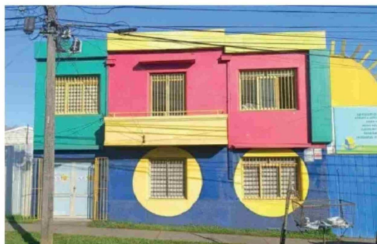
JARDÍN UBICADO en calle Arturo Prat, robo el miércoles 4 septiembre 2024.

que nosotros en coordinación con las policías podamos generar acciones que generen un impacto importante en la ciudad", señaló la delegada Purrán.