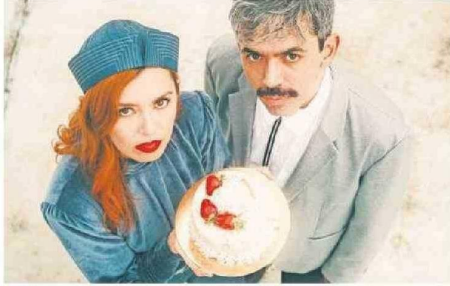
El dúo pop cuenta con una amplia fanática en la capital regional.

doctor 'honoris causa', un reconocimiento que es "un honor muy grande" porque es en su tierra, según explicaba el mismo artista en una reciente entrevista con Efe.