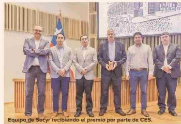
Equipo de Sacyr recibiendo el premio por parte de CES.