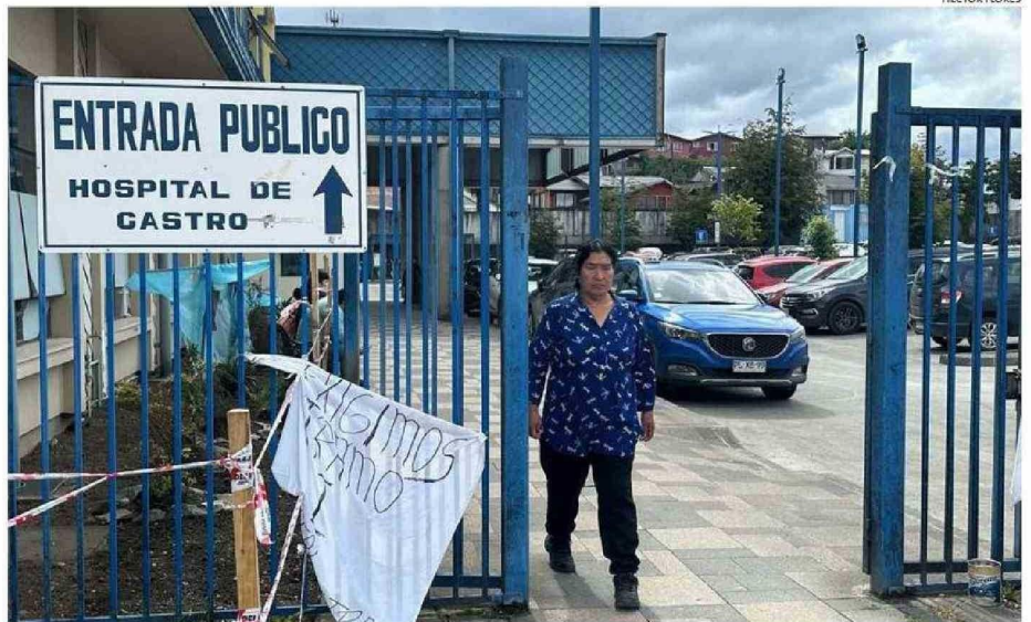
UNA MAYOR INFRAESTRUCTURA REQUIERE EL HOSPITAL DE CASTRO PARA TERMINAR CON EL COLAPSO DENUNCIADO POR DIRIGENTE.

Según explica, en la urgencia es normal que esperen entre 7 y 15 pacientes por ser internados, quienes,