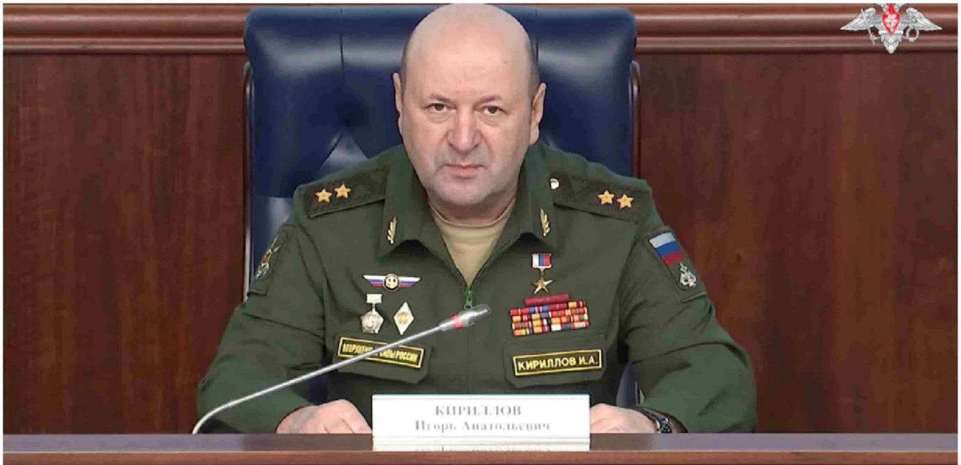
► El teniente general Igor Kirillov, jefe de las Tropas de Protección Nuclear, Biológica y Química de Rusia, asiste a una conferencia de prensa en Moscú, Rusia, el 5 de noviembre.