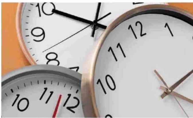
Recordar que el sábado hay que adelantar los relojes y así dar inicio al horario de verano.

La doctora y especialista en Medicina del Sueño subraya, eso sí, que "en los niños pequeños, los adultos mayo-