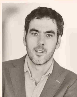
FRANCISCO COVARRUBIAS RECTOR DE LA UNIVERSIDAD ADOLFO IBÁÑEZ (UAI)

“Sin competencia no hay mejoras a la gestión y eficiencia de las AFP. Los topes máximos de las comisiones debieran estar regulados por Ley”.