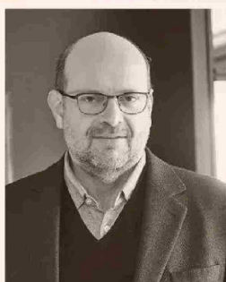
ALEJANDRO FERREIRO EXSUPERINTENDENTE DE PENSIONES

“La reforma de pensiones debe fortalecer la legitimidad del sistema y para ello es fundamental una mayor competencia y una baja de las comisiones”.