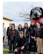
Esta escultura del perro "matapacos" se encuentra en el recinto.

recopilado. Una de las obras exhibidas es una escultura a gran escala del perro "matapacos", creada originalmente por el artista visual Marcel Solá, también creador del museo. Además, hay esculturas como "La encapuchada", que representa a las mujeres de la llamada "primera línea" de las protestas, y un conjunto de tres "tótems protectores" de madera realizados por el Colectivo Originario. Fueron instaladas en "Plaza Dignidad" durante varios meses y fueron centro de grandes rogativas y encuentros para poner en el centro de las demandas la reivindicación de nuestros pueblos originarios", relata la web del museo sobre el trío de figuras. ■