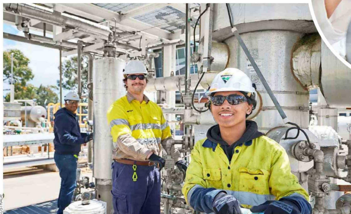
Estudiantes realizando su práctica en procesos de gas y aceite en el Centro Australiano para la Energía y Entrenamiento de Procesos.

En la próxima década, se estima que más de nueve de cada diez nuevos empleos que se generen en Australia requerirán alguna cualificación