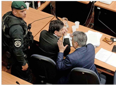
El exsubsecretario del Interior, Manuel Monsalve, al oír los delitos que le atribuyen haber cometido contra una joven exsubordinada, entre la noche del 22 de septiembre y la mañana del día siguiente.

Audiencia se suspende hasta el martes, para que la defensa pueda revisar antecedentes. Exautoridad queda detenida en un cuartel de la PDI.