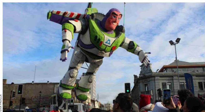
Buzz Lightyear y sus amigos los grandes actores de esta linda actividad familiar.

● Música en vivo, juegos inflables, stand de diferentes instituciones, stand de adopción de mascotas y la gran presentación del carro alegórico de Asmar, fueron parte de las sorpresas organizadas por la Municipalidad de Punta Arenas.