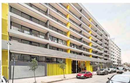
Aconcagua tiene departamentos tanto para vivir como para invertir, en tipologías que van desde 1D/1B a 3D/2B.

Actualmente, la empresa cuenta con una oferta variada de proyectos de entrega inmediata disponibles en todo el país. En concreto, en el norte, en Antofagasta y La Serena; en el centro (V Región), en Concón y Valparaíso. "En la Región Metropolitana, la oferta también es variada a nivel de comunas; tenemos proyectos de departamentos en Santiago Centro, San Miguel, La Cisterna, La Florida, Padre Hurtado, Cerrillos y Ñuñoa, mientras que de casas en las comunas de Colina y Padre Hurtado", explica