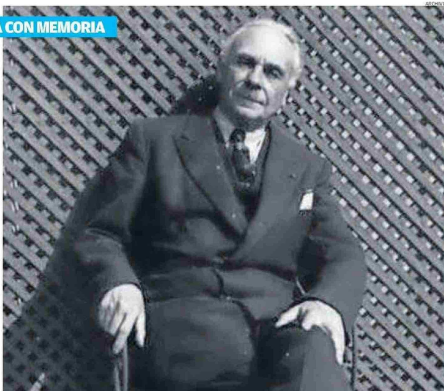
SALVADOR REYES. PREMIO NACIONAL DE LITERATURA AÑO 1967.

El ánfora de cobre estaba cubierto de flores. A bordo del "Papudo", Adolfo Ibáñez, hijo del depositario de las cenizas del escritor, leyó el siguiente radiograma enviado por la viuda del escritor: "Aquí quedarán las cenizas de quien hizo culto a la