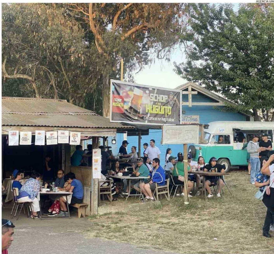
LA FIESTA EN EL ASENTAMIENTO BAQUEDANO OFRECE UNA VARIEDAD DE LO QUE EL CAMPO TIENE PARA ENTREGAR Y CONCLUIVE HOY.

rá la Fiesta Costumbrista del Maqui, organizada por la Comunidad Indígena Quintuyentué, en el recinto Ruca del sector Cuquimo.