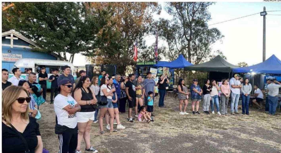
LAS FIESTAS COSTUMBRISTAS SON UN PANORAMA MUY INTERESANTE Y ENTRETENIDO PARA DISFRUTAR EN FAMILIA.

“Estamos ofreciendo todo lo que se produce aquí, con un formato artesanal. No vendemos ningún producto que sea de fabricación industrial, desde las longanizas, salchichas, papas fritas, el pan, todo es artesanal. La cerveza es toda artesanal, el borgoña es hecho en casa, también el melón con vino. Tenemos guatitas picantes, queso de pata, cazuela de pollo de campo, cazuela de vacuno, empanadas de loco, de mariscos y de carne o queso de vaca. Aquí no hay sushi, ni completos, ni ropa, solo artesanía”,