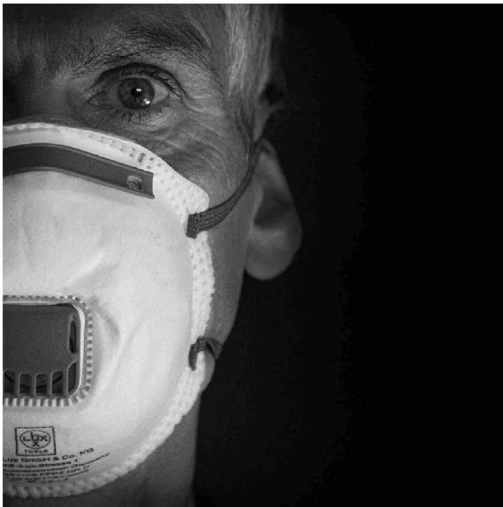
► Investigaciones sugieren diferencias en respuesta inmunitaria entre los no contagiados y los que sufrieron Covid prolongado.