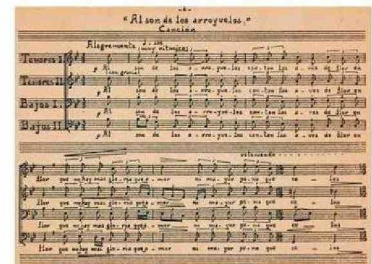
AL SON DE LOS ARROYUELOS, DOMINGO SANTA CRUZ (1941).

que hemos dado está marcado a sangre y fuego por nuestro líder fundador. Nos esforzamos por dar a conocer sus obras, sobre todo en "Pentagrama latinoamericano" por Radio Chilena FM de San Antonio. Nuestra Revista Marsyas volvió a circular porque las publicaciones académicas se distanciaron de lo eminentemente docto. Incorporamos en sus páginas textos inéditos de Santa Cruz, lo que nos llevó a indagar en las citadas instituciones.