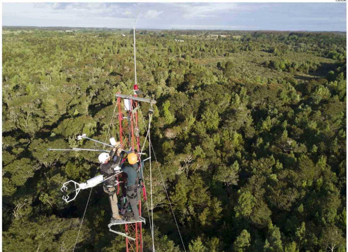
EL INVESTIGADOR SEÑALÓ QUE EL ESTUDIO DESMIENTE LA TEORÍA QUE LOS BOSQUES ANTIGUOS YA NO ACUMULABAN CARBONO.

Además, explicó que se están recolectando estos in-