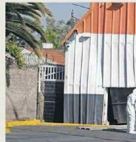
EL HECHO OCURRIÓ EN EL LÍMITE