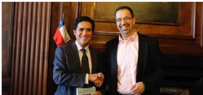
Daron Acemoglu en 2020 en las oficinas de Hacienda junto al entonces ministro, Ignacio Briones.

Por su parte, el decano de la FEN de la U. de Chile y doctor en Economía del MIT, José De Gregorio, indica que "tengo la suerte de cono-