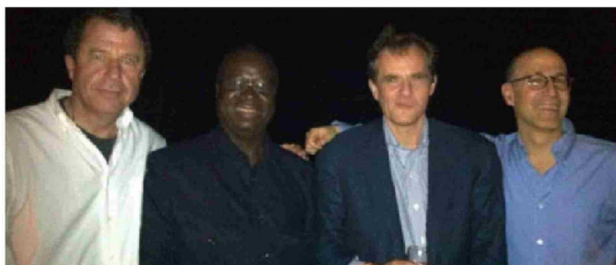
Sebastián Edwards y Simon Johnson (el tercero de izquierda a derecha), en África en 2012.

cerlos y haber aprendido mucho de ellos. Fui compañero de Simon (Johnson) en MIT donde además teníamos ambos de profesor guía a Rudi Dornbusch, y hasta hace poco éramos colegas en el Peterson Institute for International Economics. En tanto Jim y Daron, son muy amigos de Chile y han venido varias veces. Daron tiene exalumnos chilenos y durante la pandemia lo tuvimos dando una conferencia online en la FEN".