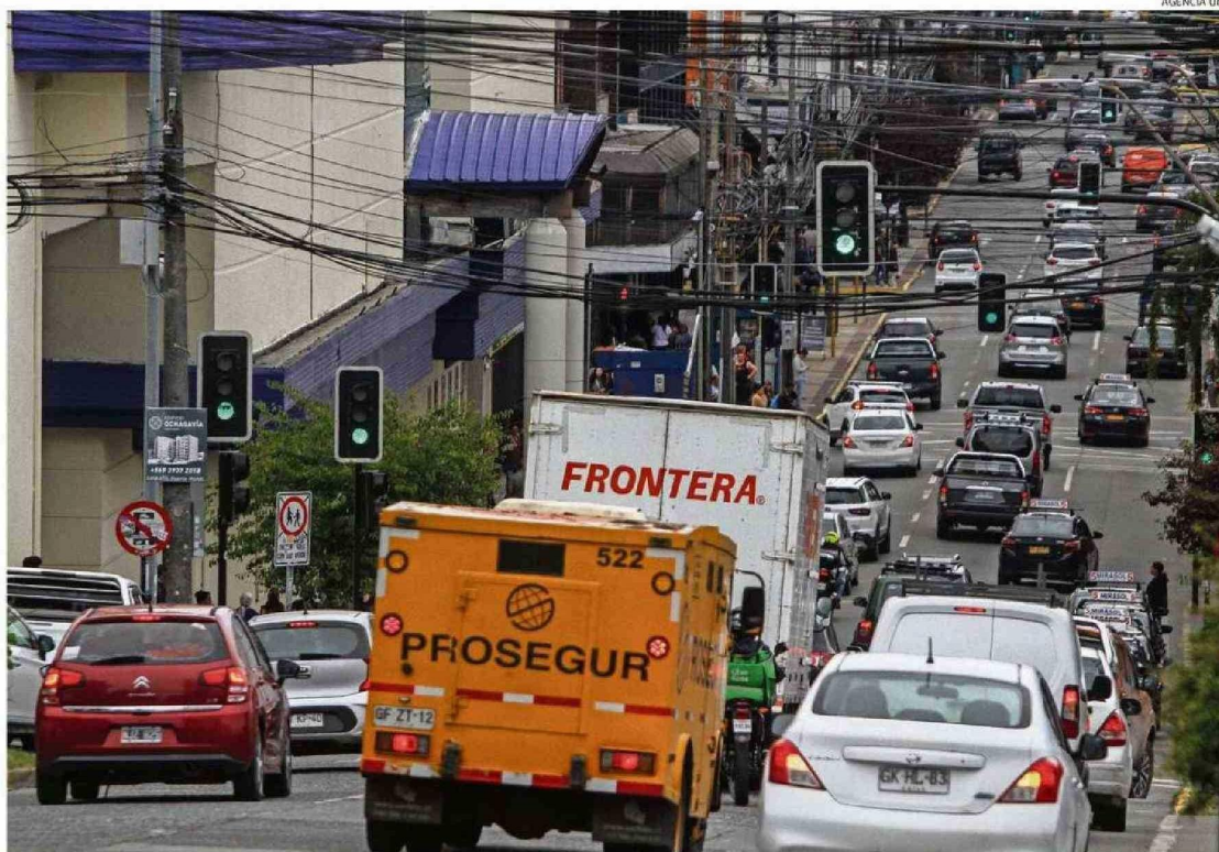
LAS AUTORIDADES DESTACARON LA RESPUESTA DE LA COMUNIDAD DURANTE EL TOQUE DE QUEDA Y EL CORTE DE ENERGÍA.

Además, destacó que la caída del sistema de pagos electrónicos representó otro problema, forzando a muchos negocios a cesar sus operaciones. "Valoramos las medidas tomadas por el Gobierno nacional y regional, como el estado de ex-