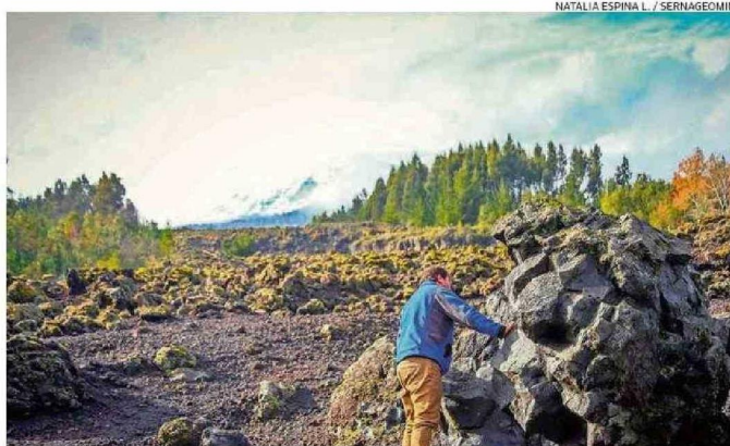
BLOQUE DE LAVA DE CERCA DE DOS METROS DE ALTURA CON BORDES ANGULOSOS PROPIOS DE LAVAS TIPO AA.