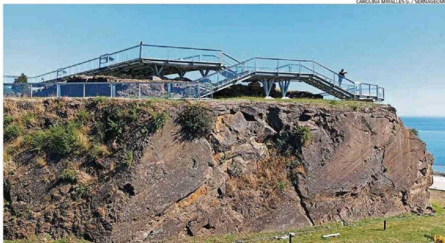
LA CANCAGUA CARACTERÍSTICA DEL MUSEO DE SITIO CASTILLO DE NIEBLA, QUE SE PUEDE VISITAR CON ENTRADA LIBERADA.

"Este libro nos permite relevar el valor de la geociencia como disciplina necesaria para producir conocimiento y enfrentar las situaciones extremas que tanto Chile como el resto del mundo vive, en relación con el cambio climático y que cada día más nos obligan a generar propuestas para frenarlo y para proteger