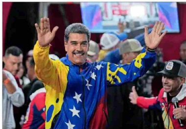
Ante sus seguidores, Nicolás Maduro celebró asegurando que había derrotado a "las sanciones y a las amenazas" y alabó la "transparencia" del sistema electoral.

Consejo Nacional Electoral le atribuyó al gobernante el 51% de los votos, cifra que fue desconocida por la oposición. Su líder, María Corina Machado, acusó fraude y proclamó como presidente electo a Edmundo González, luego de asegurar que tenía en torno al 70% de los sufragios.