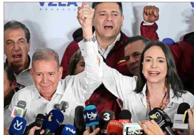
Fianqueado por María Corina Machado, Edmundo González aseguró: "Nuestra lucha continúa y no descansaremos hasta que la voluntad del pueblo de Venezuela sea respetada".

“Ganamos y todo el mundo lo sabe. (...) Esa es la verdad y es la elección presidencial con el mayor margen de victoria de la historia”.