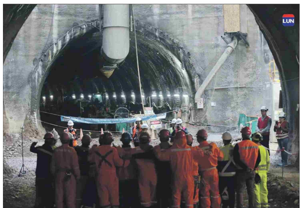
Los equipos que trabajan en la obra celebraron el hito junto al ministro de Transporte.

Ingenieros explican cómo lo hacen los equipos de constructores para no perderse a 40 metros bajo tierra.