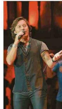
DIEGO TORRES TRIUNFÓ.

jornada y cumplió con creces. En el inicio del Festival del Huaso de Olmué, Diego Torres cautivó a El Patagual con sus éxitos. Uno tras otro: Color esperanza, Guapa y Penélope fueron parte de las 13 canciones con las que se presentó la primera noche del certamen musical. El público, se rindió a sus pies. El cantante argentino