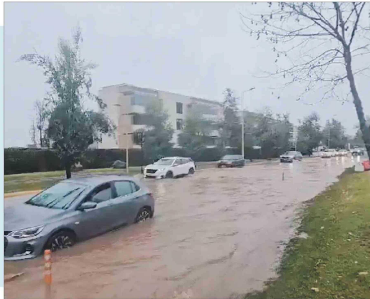
CAPTURA DE PANTALLA

Cerca de las 10.30 de este viernes, la Municipalidad de Las Condes recomendaba evitar circular por Avenida La Plaza a la altura del 1451, debido a que se encontraba parcialmente inundada. Una vez cortado el tránsito de la avenida mencionada, se habilitó una sola vía de circulación. Un equipo con un camión Jet llegó al lugar para realizar trabajos de remediación. Otras calles anegadas fueron Francisco Bulnes Correa, a la altura del 2328; Alonso de Córdova, en 4212; Vespucio Sur 507, entre otras. Desde el municipio anunciaron que sus equipos fueron desplegados a los distintos puntos de la comuna afectados.