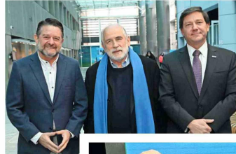
Claudio Orrego, gobernador de la Región Metropolitana; Carlos Montes, ministro de Vivienda y Urbanismo; y Juan Armando Vicuña, presidente de la Cámara Chilena de la Construcción (CChC).