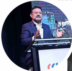
Claudio Orrego, gobernador de la Región Metropolitana, presentó el proyecto Nueva Alameda.