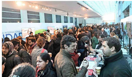
Los colaboradores entre fundaciones y universidades fueron parte de la "Conferencia Internacional de Ciudad 2024".