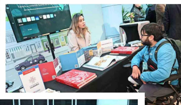
Las diversas fundaciones que participaron del encuentro explicaron los proyectos que están impulsando para la revitalización de los espacios públicos.