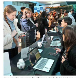
Los asistentes recorrieron los diferentes stands de las fundaciones y universidades que colaboraron en esta 13ª versión de la conferencia organizada por la CChC.