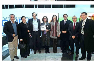
Autoridades de la CChC visitaron el stand de la Corporación Ciudad Accesible.