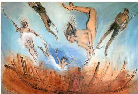
El monumental y dantesco "Gran hallazgo". Una pintura que perturba y seduce. "Creo que Ulises tenía razón con "El canto de la sirena" para alguien sensible a la belleza y la mujer".