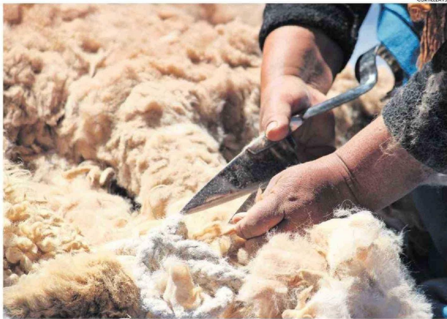
LA GANADERÍA CAMÉLIDA TIENE CARACTERÍSTICAS ANCESTRALES EN LA REGIÓN Y DE AHÍ LA IMPORTANCIA DE CONSERVARLA.

Durante la pandemia, desde la región de Arica y Parinacota se impulsó un encuentro virtual de ganaderos en el norte, y esto permitió visibilizar la necesidad de organización y asociatividad en el rubro, por lo que rápidamente se conformó una red que en poco tiempo ha logrado conseguir dos hitos muy importantes: en agosto de 2022 se firmó un acuerdo triregional entre las regiones de Arica y Parinacota, Antofagasta y Tarapacá, con el ministerio de Agricultura para establecer