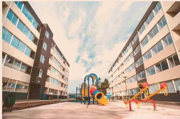
El sello de los proyectos de Brio y Nevasa es que privilegian los espacios comunes y las áreas de recreación, además de las energías renovables y materiales sustentables.

INMOBILIARIA Y CONSTRUCTORA BRIO S.A JUNTO A NEVASA: