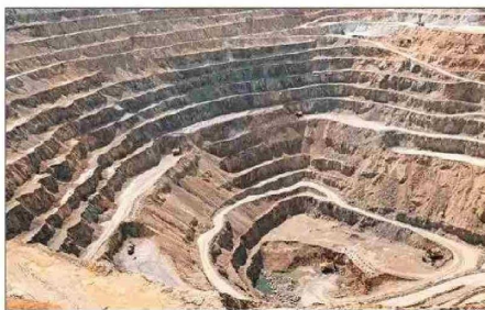
La producción minera aumentó 2,2% respecto de noviembre del año pasado y retrocedió en relación con octubre en -0,3% en la serie desestacionalizada.

12,7% en vestuario, calzado y accesorios; 8,7% en bienes de consumo diverso, y 4% en alimentos.