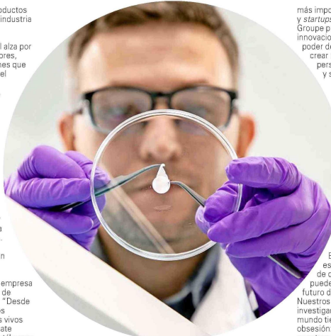
L'Oréal Groupe presentó recientemente Skin Technology, una innovación que utiliza modelos de piel bioimpresos para simular diversas condiciones dermatológicas.