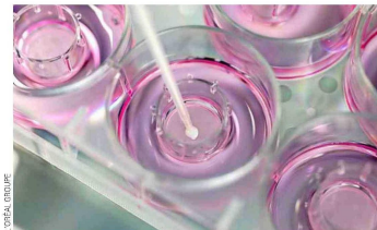
Esta tecnología se ha convertido en un recurso disponible para otras empresas, gobiernos y organizaciones que buscan alternativas al testeo animal.